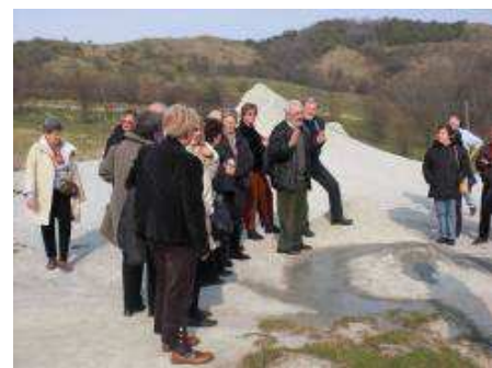
contenta della bella giornata trascorsa, merito delle Banche del Tempo.

fuori Modena, una zona collinare argillosa con tanti piccoli vulcani alla cui sommità si formavano bolle gassose e usciva acqua salata, le Salse di Nirano. Il pranzo tutto buono e ben servito con tanta cordiale allegria. A Spezzano, visita al Castello con tante notizie sul passato di questo luogo. Infine l'acetaia dove abbiamo appreso l'origine e la lavorazione di questo prodotto (aceto balsamico) così importante per loro, sia dal punto di vista economico che tradizionale. Viene tramandato di padre in figlio da tantissimi anni. Sono tornata