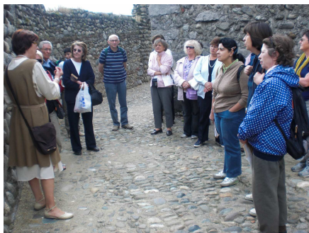
luoghi d'arte e oasi naturali della nostra zona.