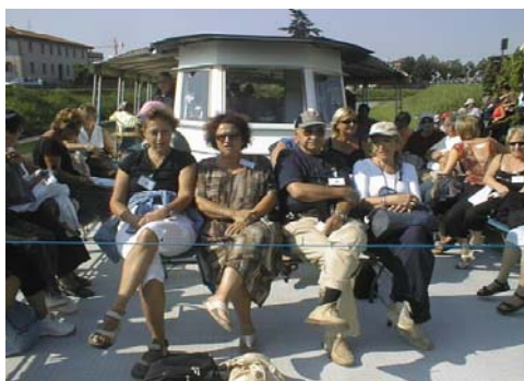
La "Villa Pisani" a Stra (Venezia), splendido gioiello chiamata anche

Un raffinato tour culturale che ci ha portato a visitare La Rotonda e la "Valmarana" ai Nani, il "Teatro Olimpico" di Vicenza, meravigliosa opera situata nel centro storico della città raffinati gioielli del Palladio.